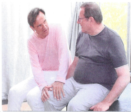
Ein vertrauensvolles Verhältnis zum Therapeuten ist besonders wichtig.

Die größten Chancen für die Rehabilitation bietet das erste Jahr und insbesondere die ersten 60 bis 90 Tage nach dem Schlaganfall. Deshalb empfiehlt es sich, die in der Klinik absolvierte Therapie auch ambulant fortzusetzen. Je kürzer die Unterbrechung, desto besser! Stattdessen wird die Entscheidung über das weitere Vorgehen an Hausärzte abgeschoben, die dazu angehalten