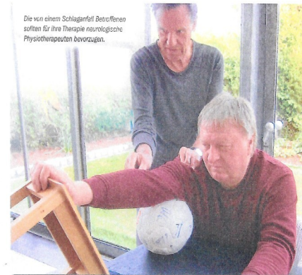
Die von einem Schlaganfall Betroffenen sollten für ihre Therapie neurologische Physiotherapeuten bevorzugen.

Es gibt keine Garantie, dass Therapie Auswirkungen von Schlaganfällen beseitigt. Intensive Therapie kann selbst nach Jahren oder gar Jahrzehnten überraschende Fortschritte bewirken. In anderen Fällen lassen sich Ziele trotz aller Bemühungen nicht erreichen. Doch selbst dann kann zumindest der Umgang mit den Einschränkungen souveräner gestaltet werden. Und eins bewirkt Therapie immer: Sie sorgt dafür, dass Betroffene und Angehörige aktiv werden, das Leben anpacken und sich Problemen stellen. Statt Opfer des Schlaganfalls zu bleiben, erforschen und gestalten sie die neuen Möglichkeiten. Das spendet Freude und Lebens-