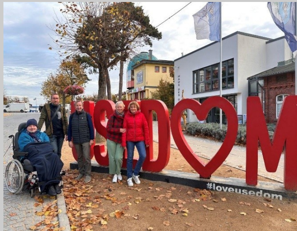
Wir lieben Usedom