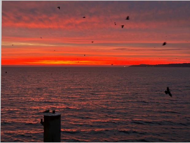
Sonnenaufgang am Strand